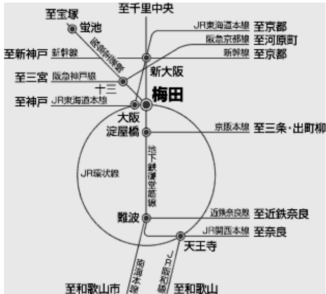
周辺地図+交通経路

事前にFAXまたはE-mail (sec@info-works.jp)にて関西センターへお申し込みください。 参加証は発行いたしません。定員になり次第申込者にその旨を通知いたします。