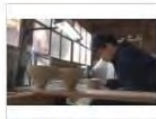
うつわ日和～土と食の素敵な出会い～