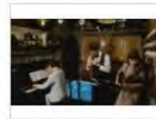
OTONOWA -音楽はいつもそばに-