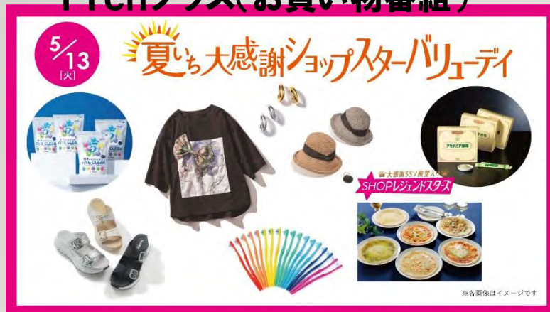
11chプラス(お買い物番組)