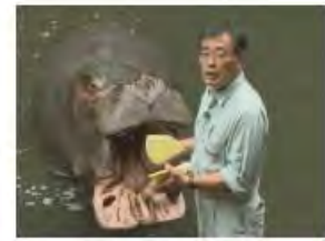
ファール伊藤の生き物日記