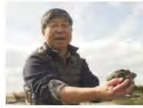
かえる先生のいきもの交遊録