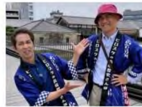
ヒロスケの長崎歴史さんぽ