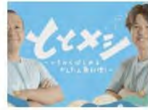
ととメシ～いちからはじめるかんたん魚料理～