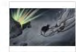
ながさきむかし そのむかし