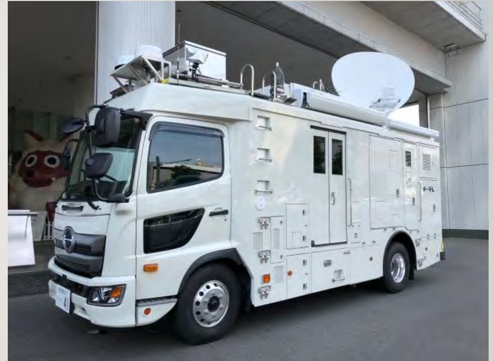
SNG中継(どこでも中継可能)