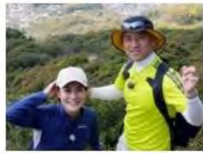
ヒロスケの長崎ぶらぶら山歩き