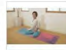
AKIYOGA ROOM -内面とつながる時間-